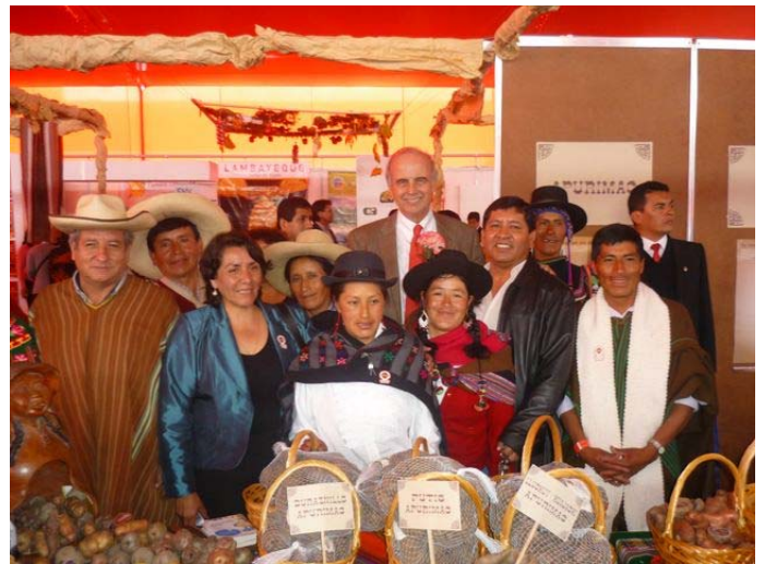
Ministro de Agricultura, Ismael Benavides, miembros del Grupo Temático de Semillas de Papa y agricultores conservacionistas en el stand de papas nativas de la Feria "Perú, mucho gusto".

A raíz del 1er Taller Internacional de Aeroponía , en octubre de 2007, se crearon diversos grupos de trabajo por país. Uno de estos fue el Grupo Temático de Semillas de Papa en Perú, una instancia técnica público-privada conformada por el sector público (INIA, SENASA, el Ministerio de Agricultura ), ONGs representantes de las comunidades de agricultores ( ADERS y FOVIDA ), la plataforma CAPAC-Perú , la empresa privada (Frito Lay) y el Centro Internacional de la Papa (INCOPA e InnovAndes). La estrategia de esta alianza fue abordar la problemática de la semilla por dos frentes, haciendo incidencia pública-política (registro de variedades nativas, comercialización y promoción del uso de semillas de calidad) e innovación técnica (nueva tecnología y sistemas de producción de semilla de calidad).