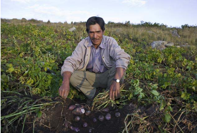
Productores podrán acceder a semillas certificadas de papas nativas mejorando su productividad.

La semilla de calidad es la piedra angular y la mejor garantía de un producto final de alta calidad. En cultivos de propagación clonal como la papa, el tubérculo-semilla sirve de vehículo para transmitir virus y enfermedades que merman su calidad generación tras generación. Por lo tanto, la única manera de cortar ese ciclo es con el uso de semilla de calidad de acuerdo a criterios técnicos establecidos y con la certificación respectiva.