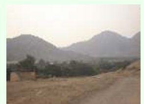
Características de la zona. Chavín, sierra y Topará, costa. Ambas carecen de agua suficiente para su desarrollo.