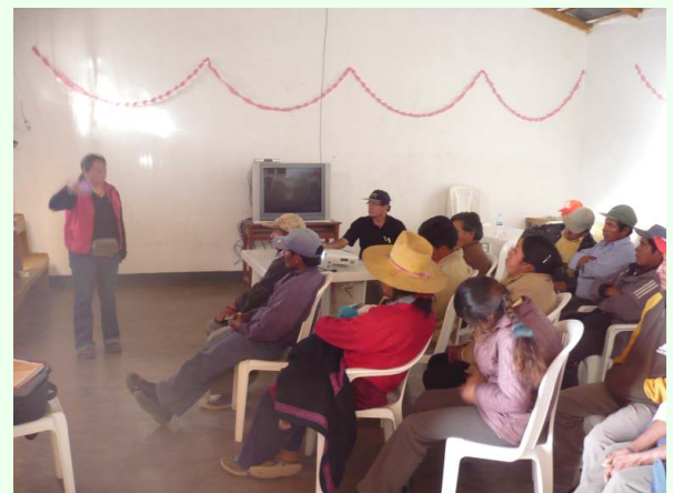
Talleres Participativos de formulación del proyecto. para el diseño ha sido de primera importancia la opinión y participación de las comunidades de Chavín y Topará.

En un plazo de tres años, el objetivo es fortalecer la capacidad productiva de las familias, robustecer su vocación empresarial y hacerlos parte de una cadena productiva relacionada con mercados competitivos a nivel interno y fuertemente vinculados a la oferta exportadora de la región Ica.