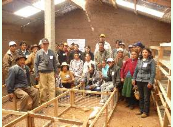
Galpón listo para la crianza de cuyes de calidad en Junipalca, Yarusyacán, Pasco.

Los animales reproductores comenzarán a entregarse a cada propietario de galpón a partir la quincena de octubre.