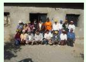
Comunidades Chitiapata y Marcocancha en Chavín. A pesar de una fuerte migración, cuentan aún con valioso capital humano. Familias que permanecen tercamente y esperan la oportunidad de salir adelante.

“Nadie es tan fuerte para hacerlo solo, nadie es tan debil para no ayudar”